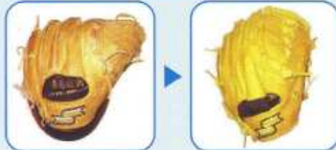
グラブ・ミットのオーバーホール

色、革も再生され、除菌、消臭もしますので、いやな臭いや、人から頂いたグラブでも新しい状態で使用出来ます。