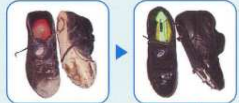
スパイクのオーバーホール 修理込み

色、革も再生され、除菌、消臭もしますので、いやな臭いや、人から頂いたグラブでも新しい状態で使用出来ます。