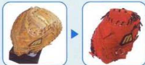
ミットのオーバーホール

(スチーマーや濡もみをして型を付けてくれるお店もありますが耐久性は極端に落ちます)